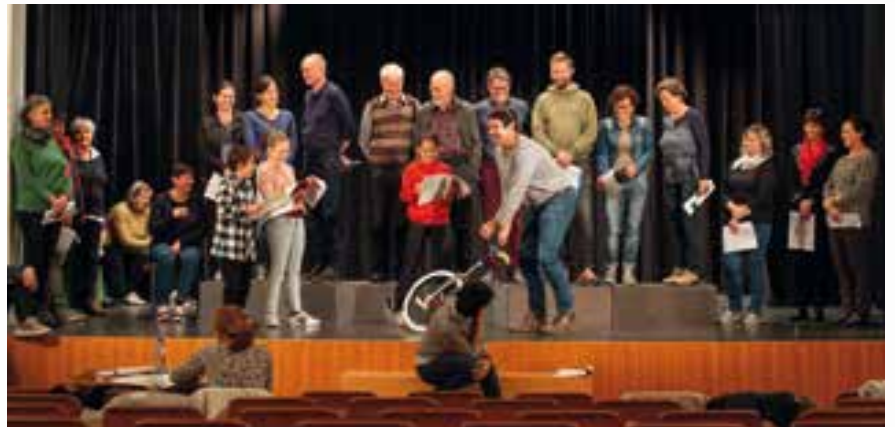
Der Kirchenchor Tabland-Staben und die Darsteller der Volksbühne Naturns bei einer Probe.

Josef und Maria sind auf Herbergssuche im Heiligen Land. Dort werden sie, wie die Geschichte weiß, von hartherzigen Menschen abgewiesen. In ihrer Verzweiflung finden sie nach Naturns und suchen dort nach einer Unterkunft für sich und das zu erwartende Kind. Das Stück hat Flucht, Fremd-Sein und Heimat zum Thema, sowie dramatische Fluchterlebnisse auf dem Meer. Lassen Sie sich mitnehmen auf die Reise von Josef und Maria durch Palästina und durch Naturns. (Hanns Fliri)