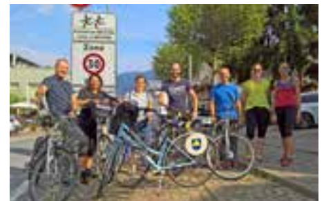
Fahrradteam beim Lokalaugenschein.

bei einer Fachtagung in Meran als PRO-BYKE-Gemeinde ausgezeichnet.