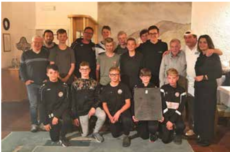
Die C-Jugend (Jahrgang 2004) des FC Stukenbrock beim Abschlussabend in der Pizzeria Hofer.

Dass fast jedes Jahr die eine oder andere Gruppe aus Stukenbrock nach Naturns bzw. in umgekehrter Richtung von Naturns in die Stadt nahe Bielefeld fährt, ist ein eindeutiger Beweis