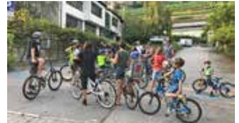
Radteam mit BürgerInnen bei der Radtour am 22. September.

Die PRO-BYKE-Fahrrad-Beratungen werden auch in Lana und Algund durchgeführt. Gemeinsam mit diesen Gemeinden wird Naturns im Frühling 2019