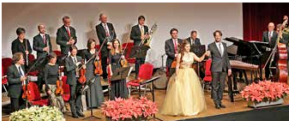
Salonorchester Südtirol.

2018 wurde erstmals die Spendenaktion zugunsten „Südtirol hilft“ im Rahmen des Neujahrskonzertes ins Leben gerufen. An dieser Idee möchten wir auch dieses Jahr anknüpfen und den Bürgerinnen und Bürgern zu Jahresbeginn jene Menschen ins Gedächtnis rufen, welche durch unerwartete Schicksalsschläge in große Bedrängnis geraten sind. So wird anstatt des Eintrittspreises zum Konzert den Besucherinnen und Besuchern die Möglichkeit geboten, eine gute Sache zu unterstützen und eine freiwillige Spende für das Projekt „Südtirol hilft“ zu tätigen. Jede Spen-