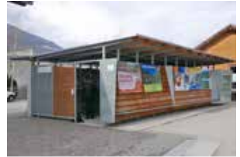
Die Radbox am Naturnser Bahnhof.

Die Radabstellanlage ist von Montag bis Sonntag von 05.00 – 24.00 Uhr zugänglich, in der Nacht kann sie nicht geöffnet werden. Die Nutzung der Radbox ist gegen eine kostengünstige Gebühr von 25 Euro pro Jahr oder auch monatsweise am Bürgerschalter der Gemeinde Naturns buchbar. Bei Bedarf kann zudem eines von sechs Schließfächern zum