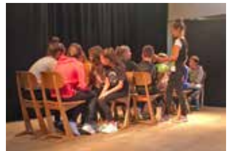
Schülerinnen und Schüler der zweiten Klassen der MS Naturns