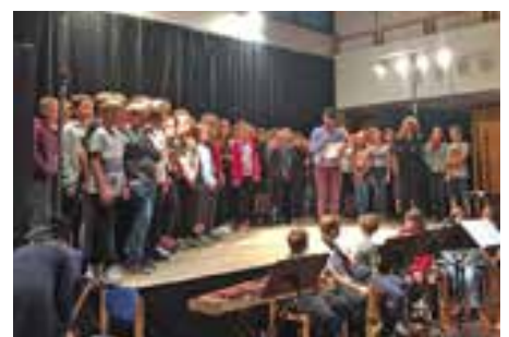
Projektwoche der 2. Klassen der Mittelschule.