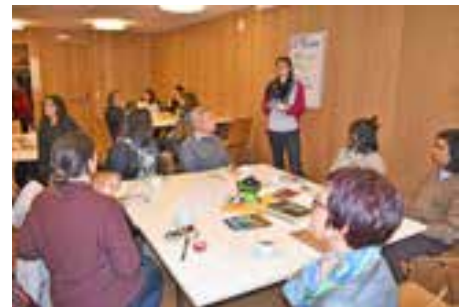
Frühstück der Religionen im Pfarrheim.