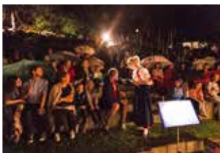
Trotz Regen spielte die Musikkapelle vor vollen Reihen.