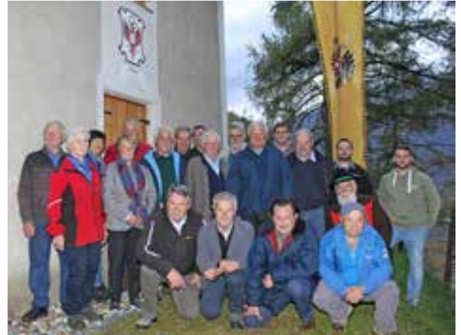
Ein Großteil der an der Restaurierung Beteiligten vor dem Schießstand in Tabland. Die offizielle Abschlussfeier wird zusammen mit der Fertigstellung des Hinzlweges, in dessen Einzugsbereich sich der Schießstand befindet, im Frühjahr stattfinden.

Nachdem durch jahrzehnte dies nur der einzige k.u.k. Schießstand wahr von