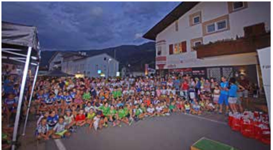
Die Teilnehmer vor der Preisverteilung.

Bei besten Bedingungen nahmen 170 Kinder und Jugendliche aus ganz Südtirol teil, das Rennen wurde vom ASV Ötzi Bike Team - Radsport organisiert. Die attraktive Strecke gefiel allen Teilnehmern, vor allem die Kulisse im Start-Zielbereich, die aufgrund der zahlreichen Zuschauer etwas Besonderes war. Unzählige freiwillige Helfer unterstützten den Verein tatkräftig und sorgten dafür, dass das Rennen erfolgreich über die Bühne ging. Die Veranstaltung wurde mit Musik von DJ Scholli und seiner professionellen Anlage umrahmt, der Sprecher Josef Platter moderierte kompetent das Geschehen. Nach dem Rennen konnten die Athleten und Betreuer noch dem regen Treiben beim Straßenfest „Nacht der Lichter“ beiwohnen, bei sommerlichen Temperaturen war dies ein gelungener Abschluss. Alle Athleten bekamen ein Teilnehmergeschenk mit ein paar Süßigkeiten. Der Ausschuss bedankt sich recht herzlich bei den freiwilligen Helfern, ein großer Dank geht auch an die vielen Sponsoren, die den Verein finanziell unterstützen. (Wilmar Gerstgrasser)