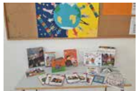
Mit 80 Büchern um die Welt der Grundschule.