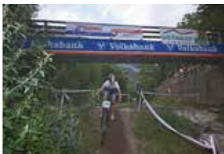
Ein Teilnehmer auf der Strecke.