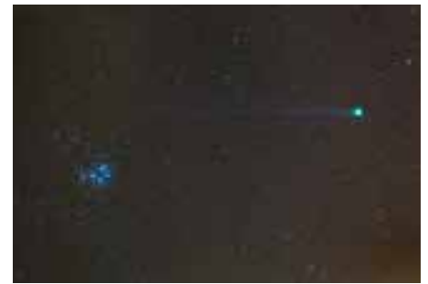
Plejaden, Komet Lovejoy.