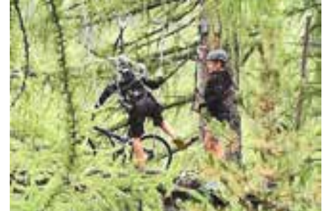
Die Handballer des SSV Naturns haben sich mit speziellen Trainingseinheiten im Sommer fit gehalten, unter anderem im Hochseilgarten.

Hinrunde / Heimspiele / U13 Bubenmeisterschaft in der Mittelschulhalle Naturns: