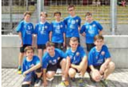
Die Youngyetis stehen vor dem Saisonstart und erwarten eine spannende Meisterschaft.

Auch im Sommer, der naturgemäß nicht als Handballjahreszeit eingestuft wird, waren die Yetis fleißig und haben sich mit speziellen Trainingseinheiten, unter