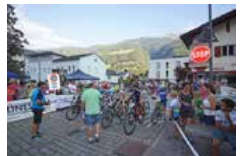
Startaufstellung der Kategorie Schüler 2 weiblich.