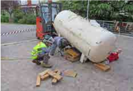
Unsere Feuerwehrjugendgruppe beim Üben.

möchtest der Feuerwehr beitreten dann melde dich beim Kommandanten Thomas Pircher unter der Tel.-Nummer 338 1002290 oder unter ff.naturns@lfvbz.org