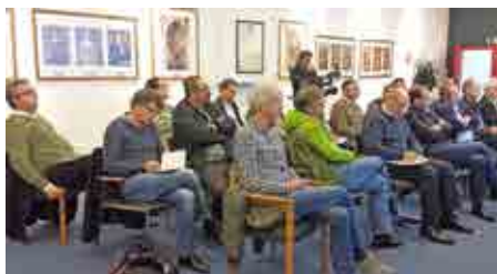
Die Bürgermeister und Referenten sowie Pressevertreter aus beiden Bezirken.