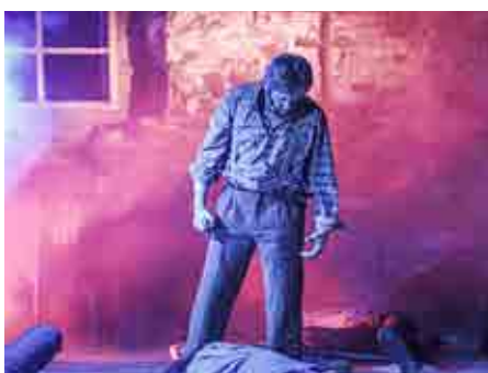
Krieg anno 1809.