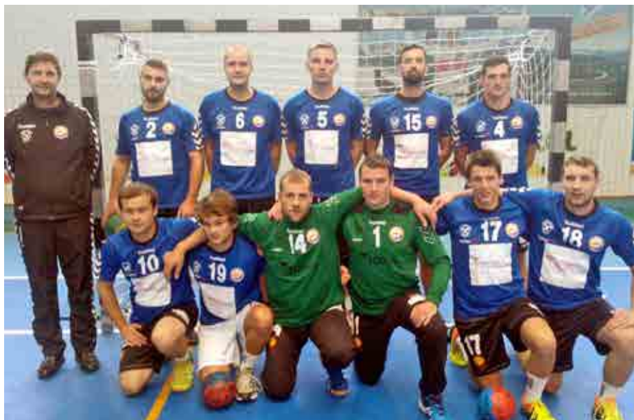
Serie B Herren: Erstes Heimspiel am 27.11. um 20.00 Uhr gegen SSV Brixen U20.

Erste Erfahrungen hat auch das U12 Team gesammelt. Für die meisten der 14 Kids war das Turnier in Brixen ihre erste Teilnahme an einem Handballturnier. Leider hatten sie das Pech, in die stärkere Gruppe gelost zu werden und so