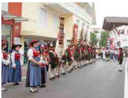
Herz-Jesu-Sonntag Ehrensalue.