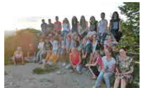
Die Gruppe der Jugendfirmlinge 2016 auf der Rocca in Assisi.

erkundeten wir Firmlinge noch die Kirche in Santa Maria degli Angeli,