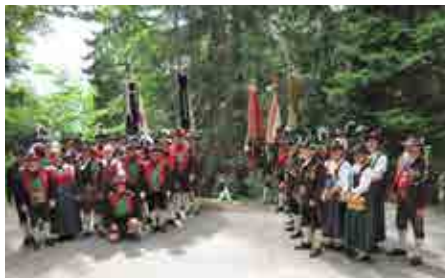
Gruppenfoto am Gedenkkreuz Werk Gschwendt.