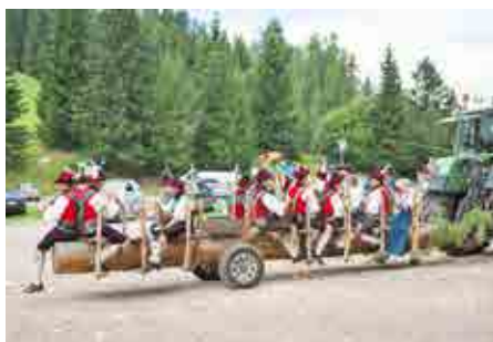
Auf der Fahrt zur Alm.

Auch nach dem Gottesdienst greift die Hochzeits-Böhmische immer wieder zu den Instrumenten, um ihre zwei Musikkollegen durch den Tag zu begleiten. Ein Highlight, „der Transport“ zur Alm, wird leider durch einen Hagel-schauer unterbrochen und lässt so