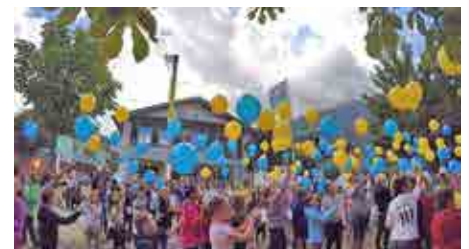
Luftballonpost der Grundschule Naturns.

führt. Das zahlreich erschienene Publikum zeigte sich sehr angetan. „Unser Film“ ist ein einzigartiges Dokument über die Menschen der Bibliothek Naturns.