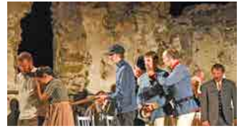
Die Verurteilten werden abgeführt.