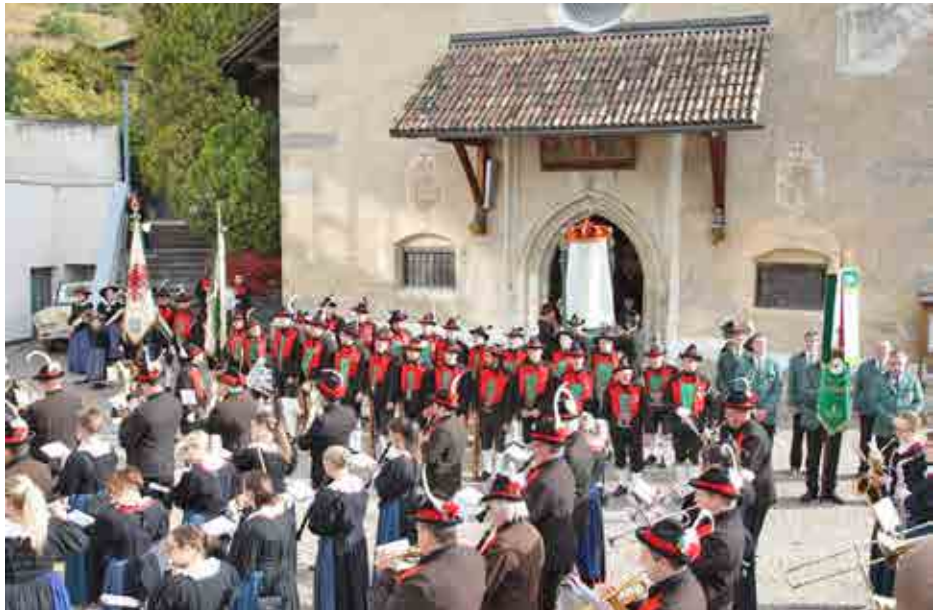
Erntedank. (Fotostudio 2000)

Einen schönen und lehrreichen Ausflug machten die Mitglieder der Schützenkompanie Naturns zusammen mit ihren Familien im September nach Passer zum Andreas Hofer Museum in St. Leonhard und dem Bunkermuseum in Moos.