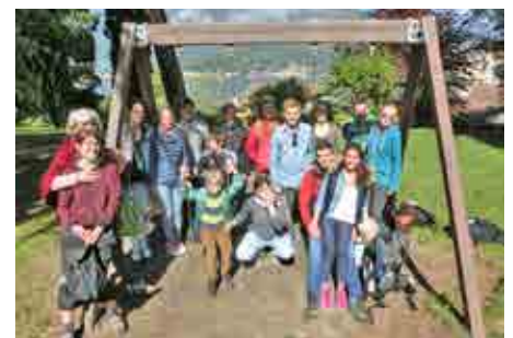
Gruppenfoto in Bellagio am Comersee.

alassistentin, die in der Nähe von Lecco für ein sozialpädagogisches Kinder- und Jugendwohnheim arbeitet, vom Leben und Wirken des Heiligen Girolamo. Sein Einsatz für die Armen und besonders für die benachteiligten Jugendlichen des 16. Jahrhunderts regte uns zum Nachdenken über ein sinnerfülltes Leben an.