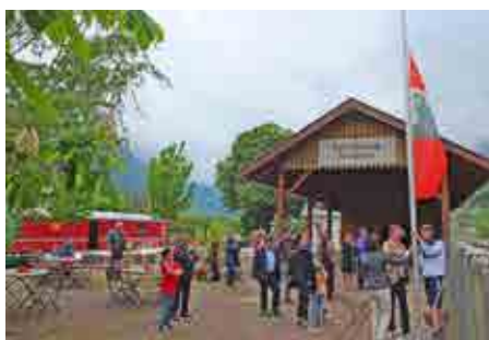
Die Vereinsfahne wird aufgezogen.

Auch in diesem Jahr hielt die Vinschgerbahn während der Öffnungszeiten direkt am Erlebnisbahnhof. Es wurden zudem 26 verschiedene Eisenbahnfilme