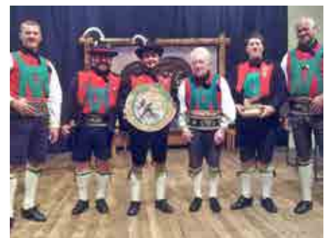
Preisverteilung 3. Rang Kompaniewertung Gedenkscheibe.

Eine gemeinsame Wanderung zur Marzoneralm mit insgesamt 50 Teilnehmern gab es im Oktober, da die Partnerschaft der Schützenkompanie Tarrenz zum offiziellen 10-jährigen Partnerschaftsjubiläum zu Besuch war. Beim traditionellen Traubenfestumzug in Meran nahmen wir mit einer Fahnenabordnung teil und gestalteten die Erntedankprozession in Naturns am darauffolgenden Sonntag in Kompanie-