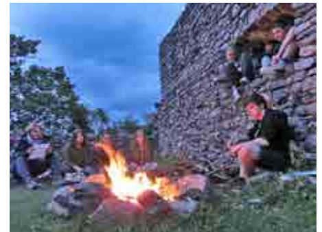
Andacht auf den Hügeln von Castelfeder.

Am nächsten Tag, wurden wir wieder in die Natur hinausgeschickt. Wir sollten aus Naturmaterialien etwas Sinnvolles gestalten. Mit einem guten Gedanken im Hintergrund, wurden die Ideen dann vorgestellt. Mehr oder weniger verbrachten wir Firmlinge die zwei Tage ziemlich mit uns allein, in Stille mit unseren Gedanken. Das Wochenende schlossen wir mit einer Andacht beim Lagerfeuer auf den Ruinen von Castelfeder ab.