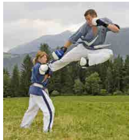
Weltmeisterin und Bronze-Medaillengewinner beim Weltcup in Aktion.