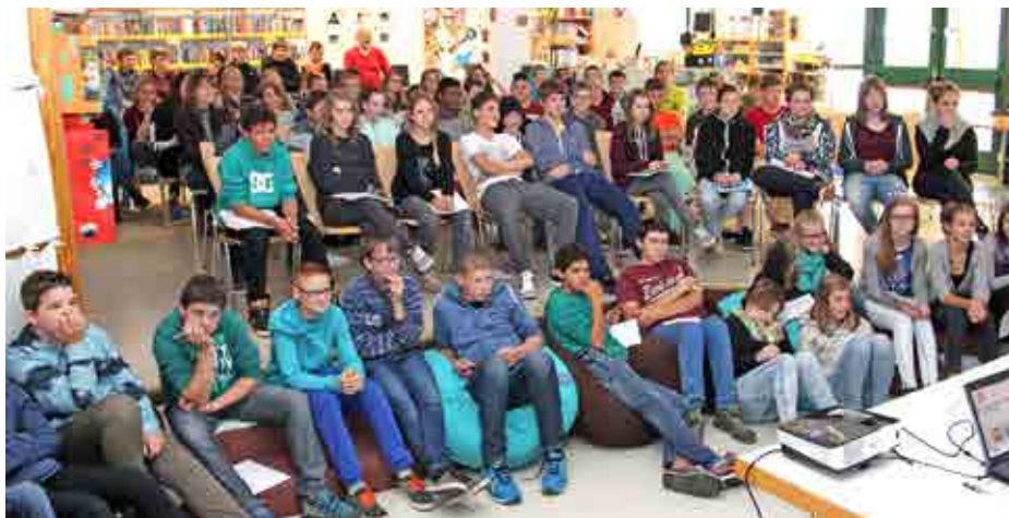
Die Schüler der dritten Klassen der Mittelschule Naturns.

Weiters erzählte er, dass es in Naturns einerseits viele mittelständische Betriebe und andererseits auch einige international agierende Unternehmen gibt. „Naturns hat das Glück, Betriebe aus fast allen Handwerkssparten vereinen