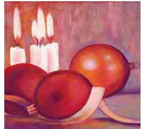
Weihnachtsidylle von Martin Pauli.

Kartenmotive und detaillierte Informationen: – im Internet unter www.menschen-helfen.it