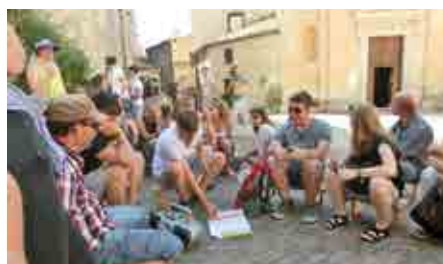
Beim Erforschen der Stadt Assisi.

Viel Neues wurde in Kleingruppen erforscht und dann der ganzen Gruppe präsentiert. Dass so viel Geschichte in so einer kleinen Stadt steckt, hätte niemand geglaubt. Einen Höhepunkt bildete ein Wortgottesdienst in der kleinen Kirche San Stefano mitten in der Stadt. Bevor wir uns auf den Heimweg machten,