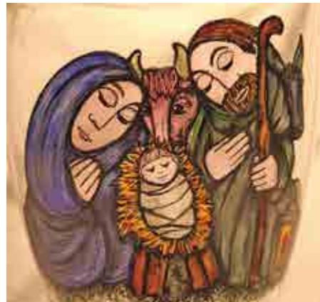
Heilige Familie von Heidemarie Ramoser.

Nun stellen wir Ihnen neue Motive zur Auswahl vor, die uns dankenswerterweise Südtiroler Freizeitmaler kostenlos zur Verfügung gestellt haben. Unterstützen Sie unsere Aktion und schenken Sie doppelte Freude: dem Empfänger mit einem persönlichen Kartengruß und Jenem, der sich in einer finanziellen Notsituation befindet. Wir können Ihnen dies nur ans Herz legen und uns für jeden noch so kleinen Beitrag bedanken.