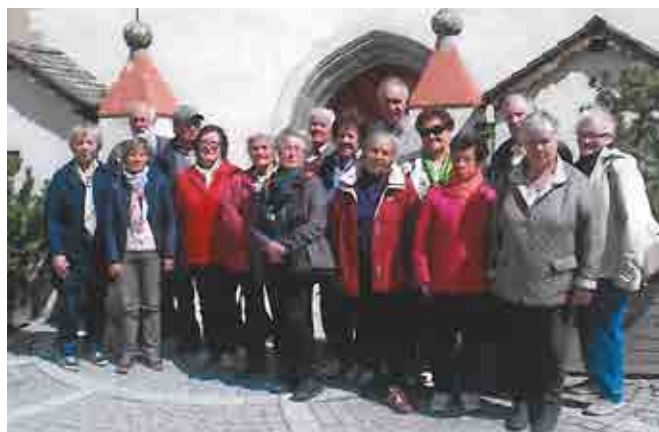
Senioren-Sängerausflug Schnals 29.04.2015.

Unser nächster Termin für das gemeinschaftliche Singen ist Mittwoch, 16. Dezember um 15.00 Uhr im Pfarrsaal.