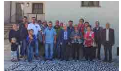
Gruppenfoto Ausflug Andreas Hofer Museum beim Sandwirt i.P.