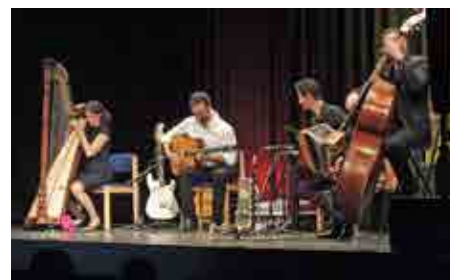
Konzert in Naturns.

Das Unbändige in dieser Musik, die Souveränität des Spiels fanden auch hier großen Anklang: Naturns bot an