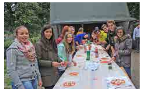
Gemeinsam Pizza zubereiten.