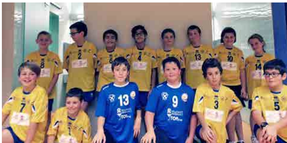
Die Youngyettis der U20 konnten beim Turnier in Brixen ihren ersten Punkt ergattern.

verlor man drei der vier Spiele (13:1 gegen die Youngsters A aus Meran, 10:1 gegen das JZ Eisacktal A und 9:3 gegen Bozen B). Doch gelang den Neo-Yettis auch bereits der erste Punktgewinn bei der: Das 7:7 Unentschieden gegen JZ