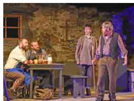
Die Räuber finden Unterschlupf.