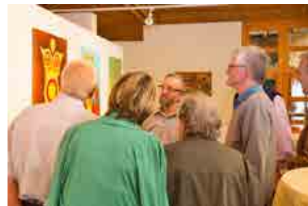
Der Künstler mit aufmerksamen Betrachtern.

Nichts bei Winkler liegt platt sichtbar an der Oberfläche. Der Betrachter ist angehalten, sich damit auseinanderzusetzen, einzudringen in das Dargestellte. Die Formgebung trägt viel Symbolik in sich. Man wird zur Ausweitung seiner Phantasie und zur Suche nach dem Erfassen des Bildinhalts angeregt. Die Kunst sollte eigentlich die natürliche Neugier des Menschen zugleich wecken und zum Erkennen der Bedeutung der Erscheinungen bringen. Durch die heutige Bilderflut der Medien endet die Neugier aber oft in der bloßen Zerstreuung. Das Werk von Josef Winkler hilft