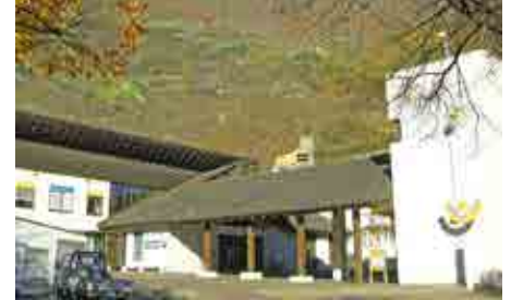
Rathaus – Hochnaturns.

auf den schönen Tag und die Besonderheiten in Kirche und Museum angestoßen. (Maria Kreidl)