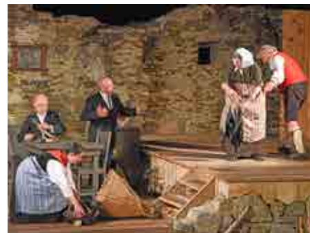
Trinele stört das Dorfgericht.