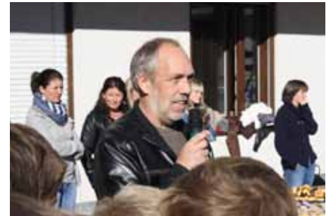
Grußworte des Direktors des Schulsprengels.