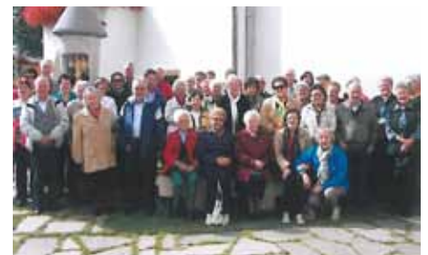
Wallfahrt nach Unsere liebe Frau im Walde am 25. September.

Offenes Singen für Senioren 60+ beim Adlerwirt um 15.00 Uhr