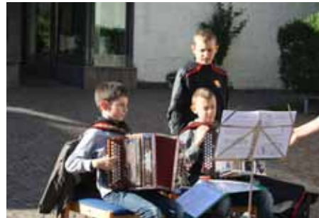
Musikalischer Gruß an die Gäste.