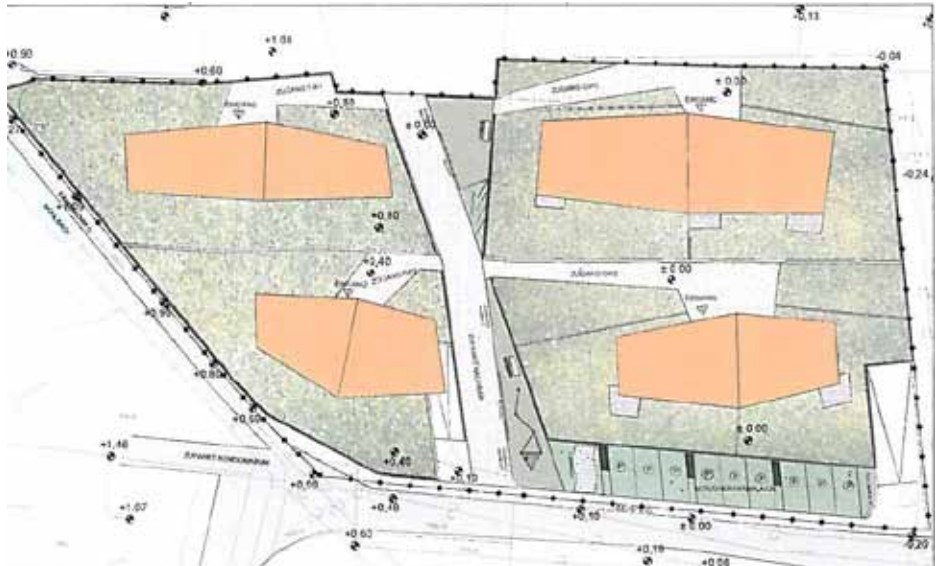
Rechtsplan EWZ „Schweitzer“.

Wohnbau und den Antragstellern für den Bau von Wohnungen für den Mittelstand zugewiesen werden können. Dazu zählen: