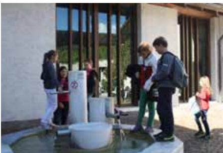
Erste Kontakte werden geknüpft.