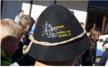
Gruß an Naturns.