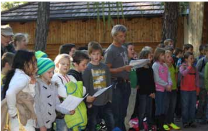
Gemeinsames Singen verbindet.