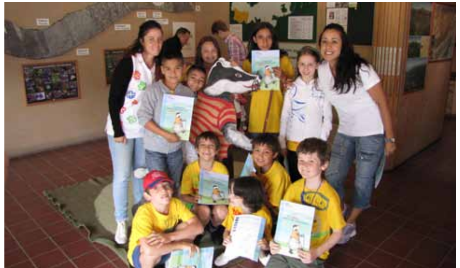
Eine Schulklasse zu Besuch im Naturparkhaus.

Auch dieses Jahr war das Naturparkhaus Partnerbetrieb beim Projekt JUNWA. Insgesamt standen 100 Stunden zur Verfügung und 10 Kinder erklärten sich bereit im Naturparkhaus ihren Dienst zu leisten. Neben Instandhaltungsarbeiten im Haus und im Außen-