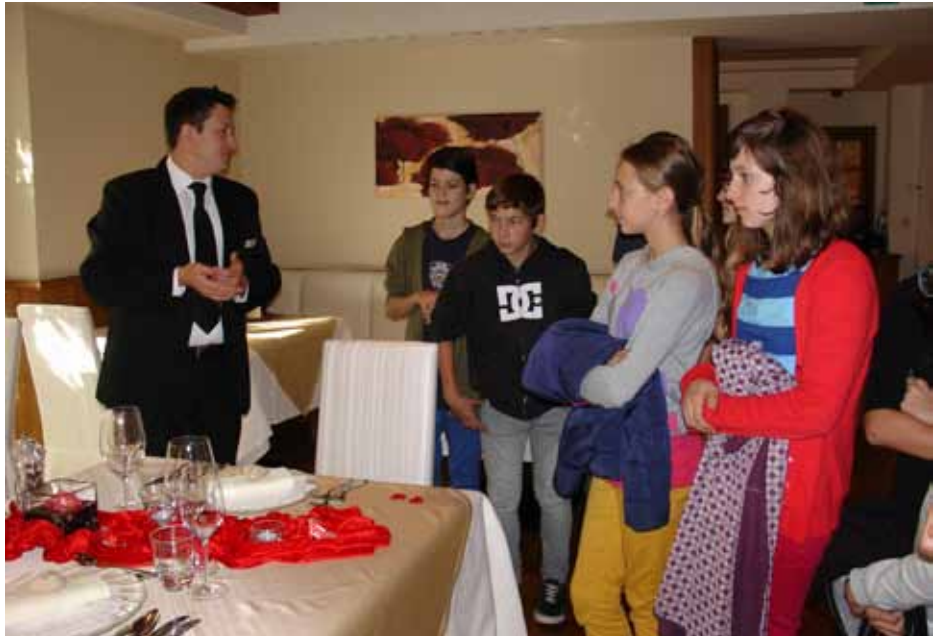
Die interessierten Schüler der Mittelschule Naturns bei der Präsentation der Berufe im Hotel „Preidlhof“.

„Mit der Berufsinformationskampagne möchten wir die Schüler bei ihrer Berufswahl unterstützen. Durch die Besichtigungen in den Betrieben vor Ort erhalten Schüler einen konkreten Einblick in die vielfältigen und kreativen Berufe im Hotel- und Gastgewerbe und