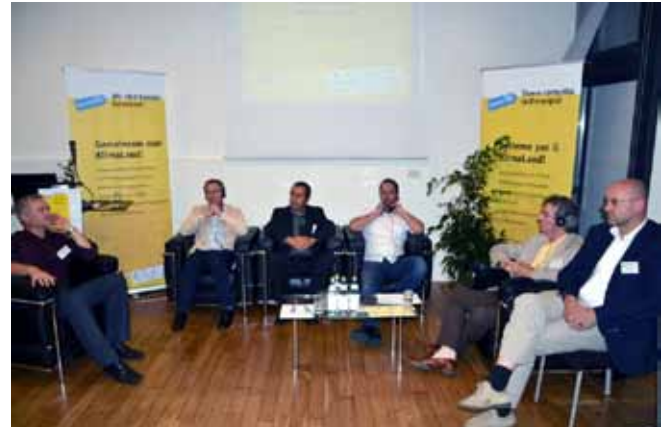
Im Rahmen des Gemeindetags A++ wurden auch Projekte aus Naturns als "Best Practices" vorgestellt.