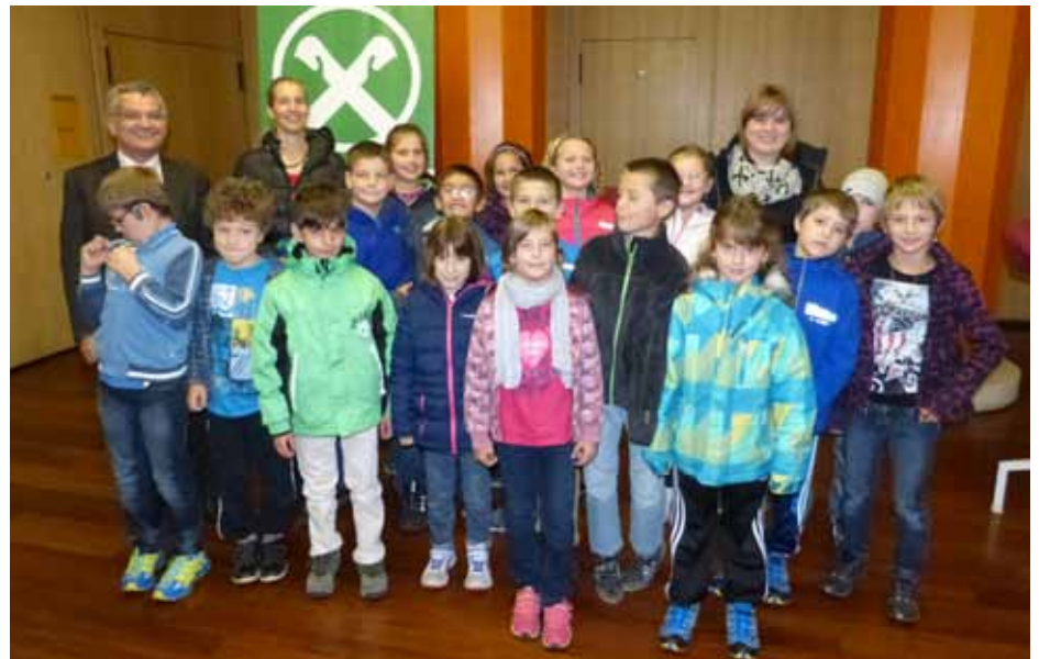
Die Schülerinnen und Schüler der Klasse 3A der GS Naturns mit ihren Lehrpersonen.

Eine wunderbare Welt voller bunter Tiere und Pflanzen ist es, in der das Meer volk lebt. Eine Welt, in der sich Marie, die kleine Meerjungfrau, so sicher und frei bewegen kann, wie ein Fisch im Wasser. Und trotzdem will sie fort, hinauf in die andere Welt jenseits der Wasseroberfläche. Aber warum die Welt verlassen in die man geboren wurde? Warum nur, fragen sich auch Kasimir, der Kugelfisch, und vor allem Maries Vater, der mächtige Meerkönig. Marie hat während eines Sturmes einen jungen Menschenprinzen vor dem Ertrinken gerettet und sich in ihn verliebt. Ihre Sehnsucht ihn wieder zu sehen und ihre Neugier auf seine Welt sind so groß, dass sie sich auf einen gefährlichen Handel einlässt. Sie gibt der alten Meerhexe ihre bezaubernde Stimme um dafür an Land leben zu können. Damit geht die kleine Meerjungfrau allerdings ein großes Wagnis ein, denn wenn es ihr nicht gelingt das Herz des Prinzen zu erobern,