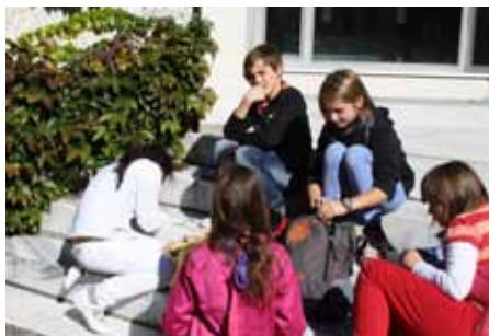
Adressen werden ausgetauscht.