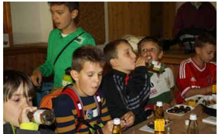
Hm, die Kastanien schmecken.