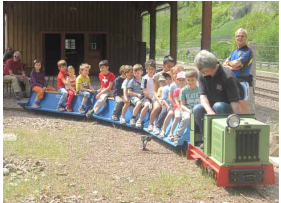
Erfolgreiche Saison 2013 am Jugend- und Erlebnisbahnhof.

20 freiwillige Helfer des Vereins Freunde der Eisenbahn hatten dies mit mehreren Hundert ehrenamtlich geleisteten Stunden möglich gemacht. Ihnen gebührt ein aufrichtiger Dank. So war es selbstverständlich, dass dies Ende Oktober mit dem Vorstand gebührend gefeiert wurde. Auch in diesem Jahr hielt die Vinschgerbahn während der Öffnungszeiten direkt am Erlebnisbahnhof, am alten Bahnhof Schnalsthal. Neu war, dass am Eingang ein Originalwaggon der Laaser Schmalspurbahn mit einem Marmorblock aufgestellt wurde. Ein Postwaggon der Rhätischen Bahn diente dem gemütlichen Beisammensein, während im anderen Filmvorführungen über Eisenbahnen aus aller Welt, Ausstellungen über die Schrägbahn Laas und die Rhätische Bahn mit Original Führerstand, gezeigt wurden.