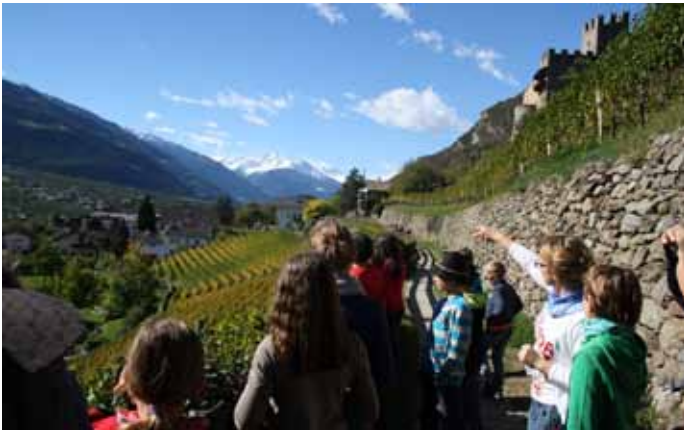
Vorstellung unseres Dorfes.