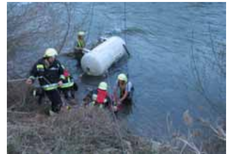
Übung „Person unter Last in der Etsch“.

abgehalten. Die Schwerpunkte unserer Ausbildung lagen in der theoretischen und praktischen Vorbereitung auf den Atemschutzeinsatz und die Rettung aus Höhen und Tiefen.