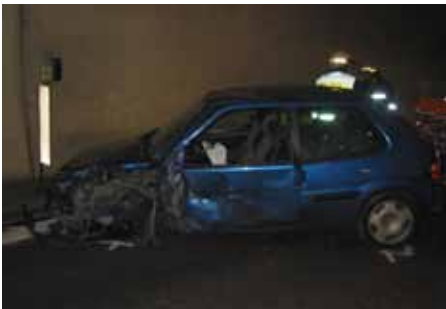
Verkehrsunfall im Tunnel Staben.

56 technische Einsätze, Verkehrsunfälle und Aufräumarbeiten, Auspumparbeiten, Ölwehr, Gaseinsätze, usw.