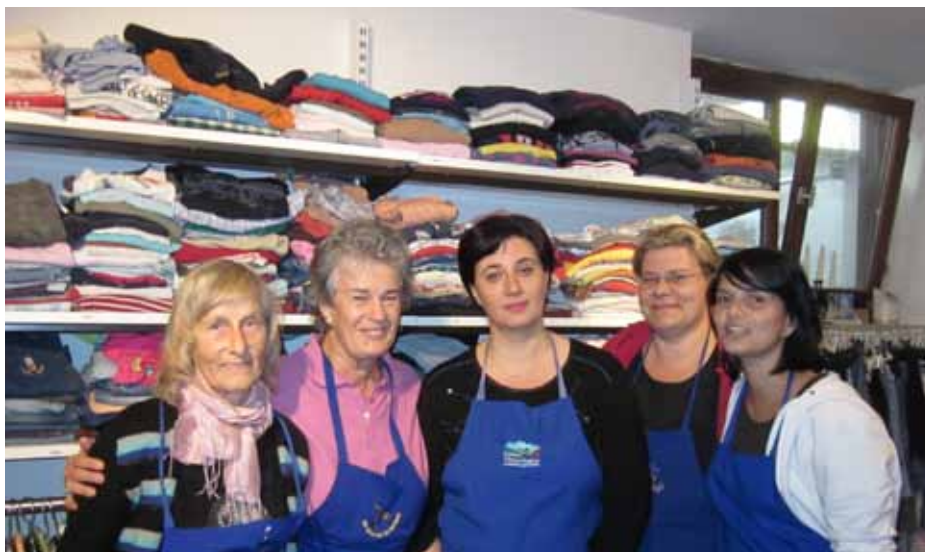
Freiwillige der Kleiderstube Wilma in Rabland.

Insgesamt 18 Freiwillige arbeiten abwechselnd in der Kleiderstube, im Un-