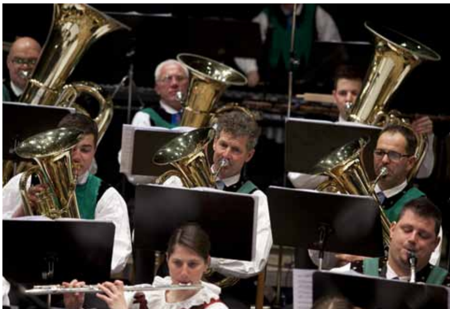
Tenorhörner und Bässe.

Im heurigen Schuljahr wird auch weiterhin an den Samstagabenden fleißig geprobt, sodass wir uns jetzt schon auf weitere Auftritte der Jugendkapelle freuen können. (Steffi Pföstl)