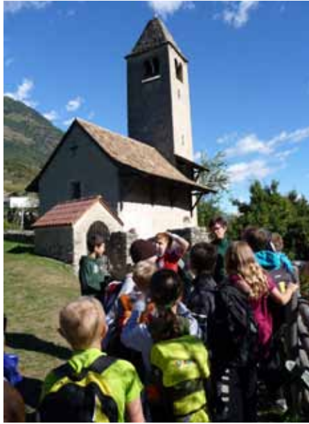
Besuch der Prokuluskirche.