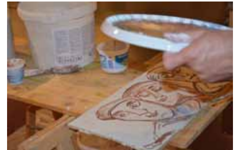
Entstehung eines Freskos.

ser besondere Museumstag sicher wieder als großer Erfolg gewertet werden. Das Museum dankt den Projektpartnern von „Stiegen zum Himmel“ für die vielfältige Unterstützung. (Stefanie Tarrotti)