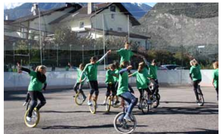
Einlage der Einradgruppe Naturns.