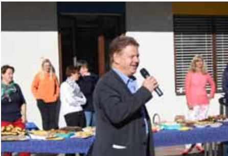
Grußworte des Bürgermeisters.