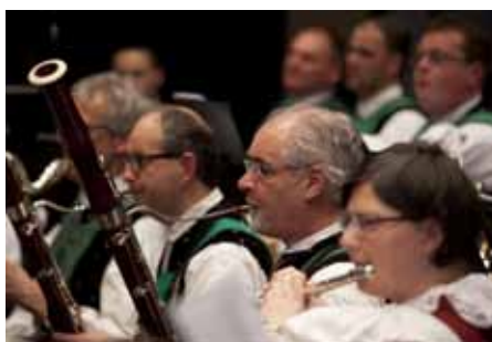
Fagotte und Flöte.

Auch für den heurigen konzertanten Saisonsausklang am 24. Oktober im Bürger- und Rathaus von Naturns hatte Kapellmeister Dietmar Rainer einen bunten musikalischen Reigen mit ausgewählten Musikstücken des abgelaufenen Jahres zusammengestellt. Die