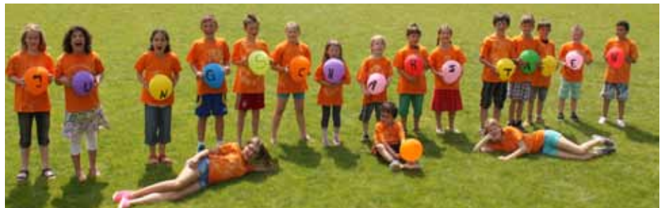
Gruppenfoto Jungschargruppe Staben.

vorführung eingeladen sind. Das Gruppenfoto der JS-Gruppe Staben wurde beim Fotowettbewerb der „Dolomiten“ zum 60-jährigen Jubiläum der katho-