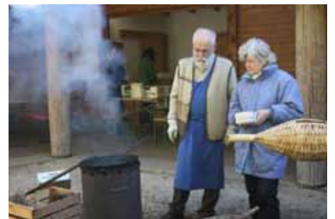
Alle Vorbereitungen fürs gemeinsame Törggelen werden getroffen.