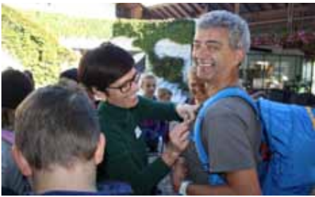
Button mit dem Logo der Partnerschaft werden angesteckt.