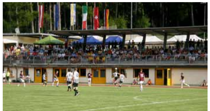
Tolle Kulisse beim Finale Nürnberg-Udinese.

des Amtes für Sport der Autonomen Provinz Bozen, der Gemeindeverwaltungen von Naturns, Partschins, Plaus und Schnals, der Raiffeisenkassen von Naturns, Partschins und Schnals, des Tourismusvereins Naturns, des HGV und von Naturns Aktiv. Allen sei an dieser Stelle nochmals herzlich gedankt. (Günther Pföstl)