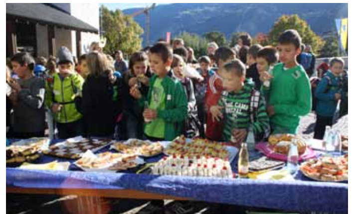
Stärkung am reichhaltigen Buffet.