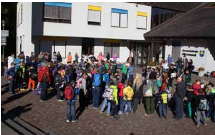
Empfang vor der Gemeinde.