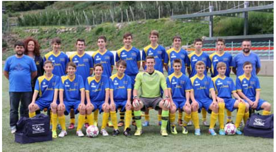
Die A-Jugend regional der SpG Untervinschgau.

Auf gute Stimmung bei der großen gemeinsamen SpG-Jubiläums- und Weihnachtsfeier am 21. Dezember im Bürger- und Rathaus von Naturns kann man sich auf jeden Fall freuen. (Günther Pföstl)