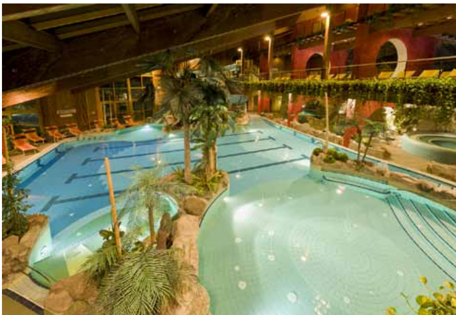
Für 270.- Euro kann die ganze Familie das Erlebnisbad ein Jahr lang genießen.

Familienfreundliche Gemeinde: Familienjahreskarte 2014 für das Erlebnisbad für nur 270 Euro