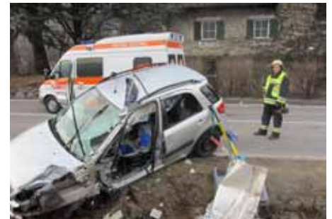
Verkehrsunfall Plauser Gerade.

Um die Einsätze erfolgreich abarbeiten zu können, bedarf es ständiger Fort-