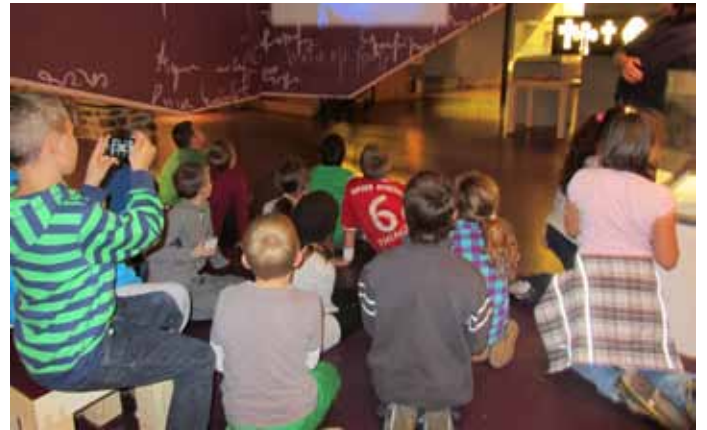
Besuch im Prokulusmuseum.