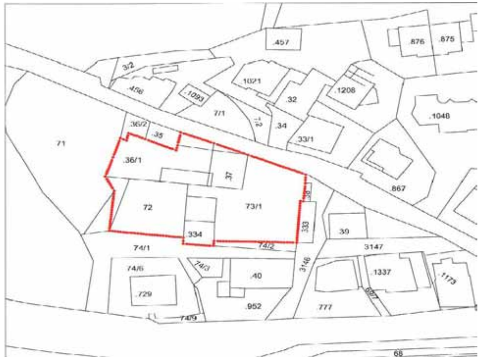
Lageplan Wohnbauzone „Lahnweg“.

Nun geht es darum die nächsten Schritte in die Wege zu leiten, damit die beiden Baugrundstücke möglichst bald den Antragstellern im geförderten