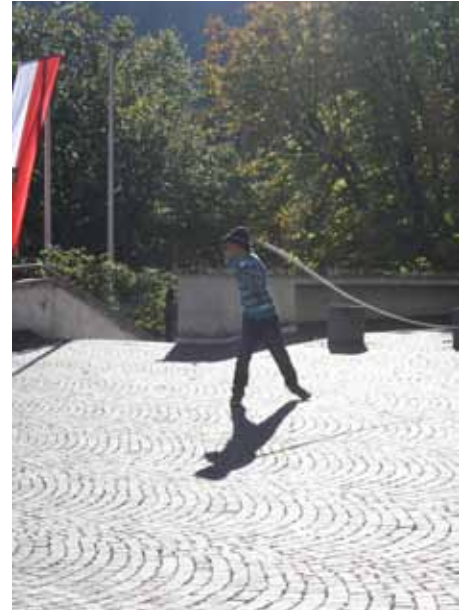
Gruß an Naturns.