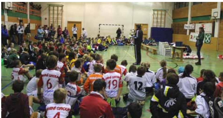
Zahlreiche Handballfans aus ganz Südtirol sind zum ersten VSS U12 Turnier nach Naturns gekommen.