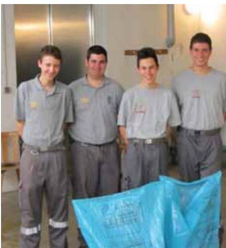
Teilnahme am Dorfreinigungstag in Naturns.

Sonntagsbereitschaftsdienste in den Sommermonaten, 26 Brandschutz- und ein Ordnungsdienst bei diversen Veranstaltungen, Lehrgangsbesuche an der Landesfeuerweherschule